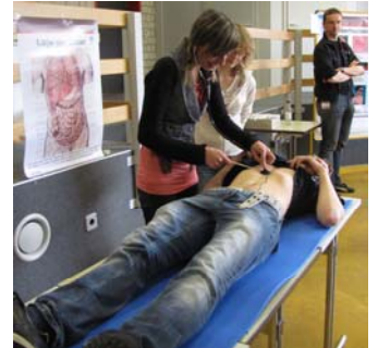
Schüler suchen Lebergrenzen